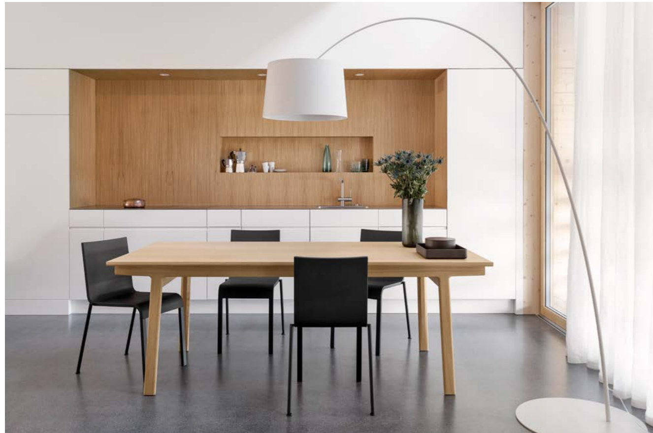
Untergestell Eiche, natur lackiert Platte Eiche, natur lackiert Kante K 06

Auf den Längsholmen des Untergestells lässt sich das Tischblatt elegant verschieben. Dabei legt es die aus Massivholz gefertigte Gestellstruktur und das verborgene Erweiterungselement frei. Die handliche Einlage ist wahlweise in massivem Holz oder in einer Leichtbaukonstruktion mit schwarzem Kern und einem hochwertigen, äusserst kratzfesten Belag in FENIX NTM erhältlich. Mit eingesetzter Tischverlängerung entsteht im Nu Platz für vier weitere Gäste.