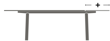
Auszugstisch Extendable table